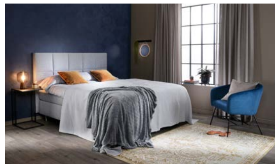
Alla: Emma-jenkkisänky edustaa Sotkan uusinta sänkymallistoa.