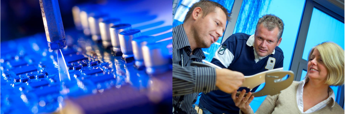
Kuvat: Kitron ASA

Kitron ASA (KIT) (Sievi Capital Oyj:n omistusosuus 33,0 %) on norjalainen pörssinoteerattu sopimusvalmistaja, joka toimii viidellä eri asiakassegmentillä. Asiakassegmenttejä ovat meri- ja öljyteollisuus, perusteollisuus, puolustusvälineeteollisuus, sairaala- ja terveydenhuoltolaiteteollisuus sekä data- ja telekommunikaatioteollisuus. Kitronilla on tehtaita ja tuotantoa Norjan ohella Ruotsissa, Liettuassa, Saksassa, Kiinassa ja Yhdysvalloissa. Lisätietoa: www.kitron.com .